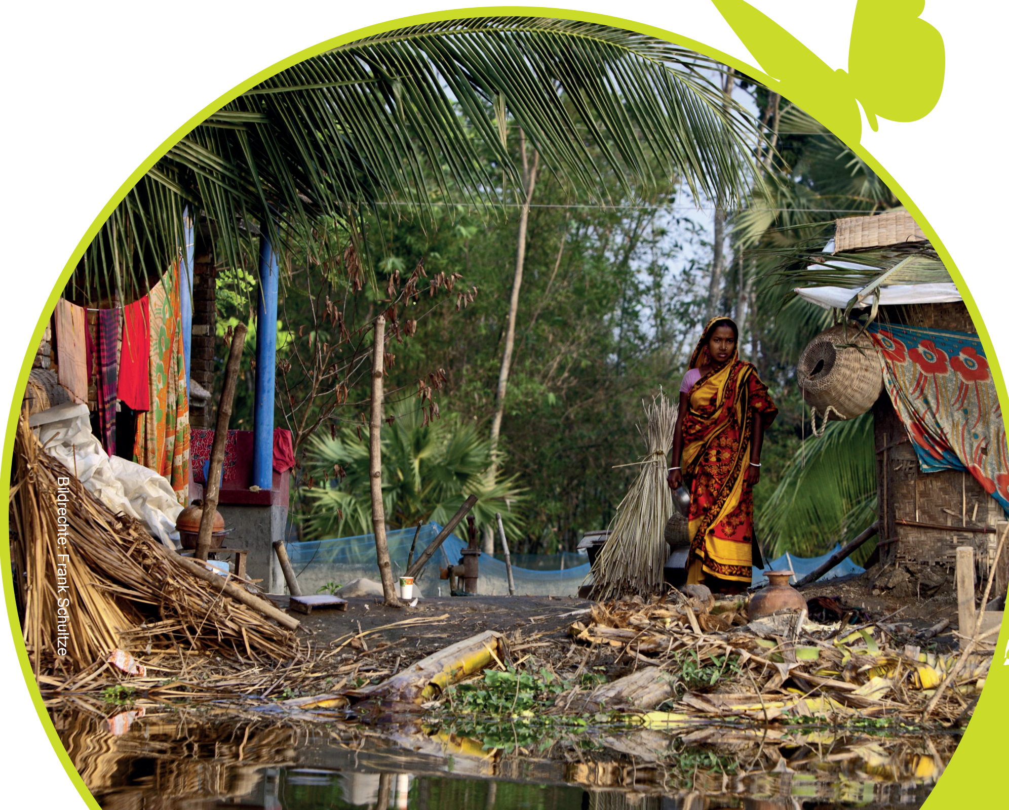
Bäuerin auf einem überfluteten Bauernhof im Süden Bangladeschs