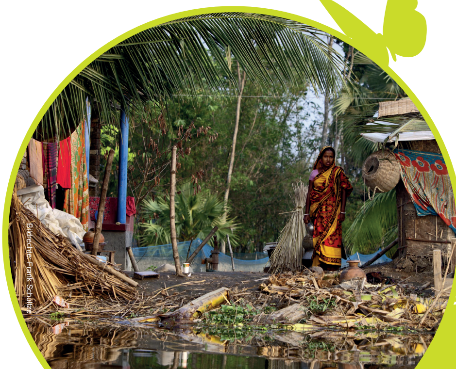
Bäuerin auf einem überfluteten Bauernhof im Süden Bangladeschs